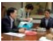
知事への要望と特産品紹介