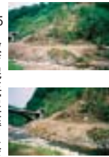
105号本荘から東由利へ

沢川調査災害査定では、国が道路災害復旧・市が道路災害 県が河川災害工事を行う方針。 崩れ地・銀河トンネル・奥名免橋右手前