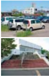
とりこわし計画の今まだ現役の文化会館