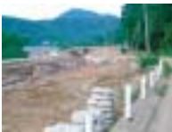
急ピッチで進む法体擁 道路工期9月28日左端 が堰堤

ダム早期着工は勿論だ が、昨年崩壊した県道大川端線から 中直根区間は特に狭隘な地点が多く 道路沿いの民家、学童の通学や通勤 に不便をきたしている、強く国・県 に既存道路の改良を要請すべき。