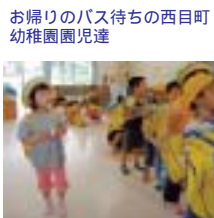
お帰りのバス待ちの西目町幼稚園児達

5月15日教育民生常任委員会現地視察・由利本荘市で唯一の市立幼稚園他に工事中の西目小学校を視察