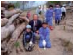
植林を終えた西目小の子供達と