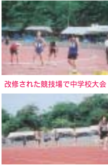
改修された競技場で中学校大会

本荘由利総合運動公園改修継続、 請負契約締結・全体で約16億円17 年・21年、19年度は5千9百万